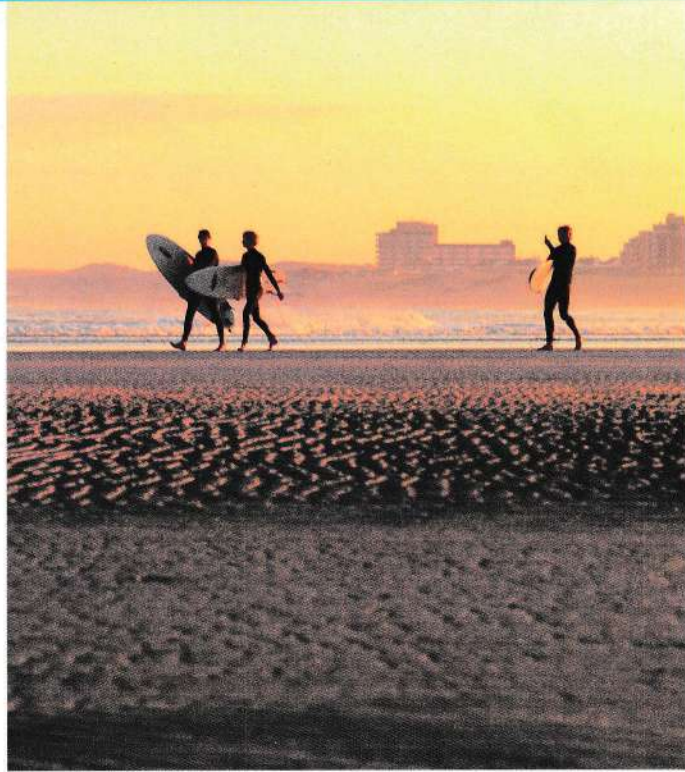
Ontwikkeling van de Zandmotor de komende 15 jaar

De Zandmotor is een uniek wad-achtig gebied dat twee keer per etmaal bij vloed onder water staat. Door dit dynamische karakter van de Zandmotor kunnen onveilige situaties ontstaan, zoals een zachte bodem of sterke zeestromingen. De veranderingen worden nauwlettend gevolgd. De situatie op en rondom de Zandmotor wordt regelmatig op veiligheid gecontroleerd. Borden en vlaggen op het strand informeren u over de actuele status. Volg altijd de aanwijzingen van de reddingsbrigade en de toezichthouders op.